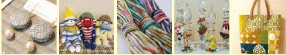
※写真は過去出展されたクリエイターの作品です。